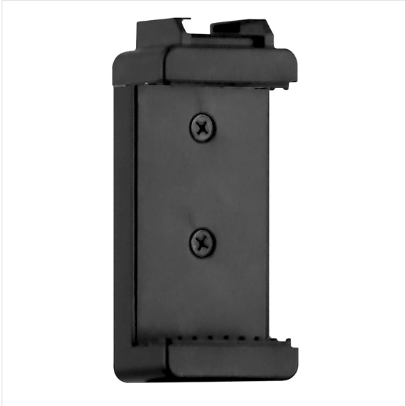
Imagen - Influencia -