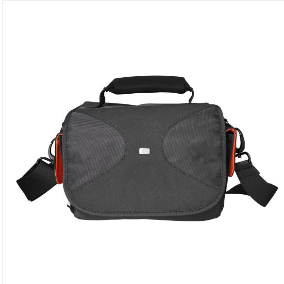
Imagen - Accesorios de cámara -

Tote bag con viscoelástica. 1 bolsillo delantero para accesorios y un bolsillo de malla en la parte trasera. interior para tarjetas de memoria Almohadilla de refuerzo para proteger el dispositivo de golpes. cubierta de lluvia