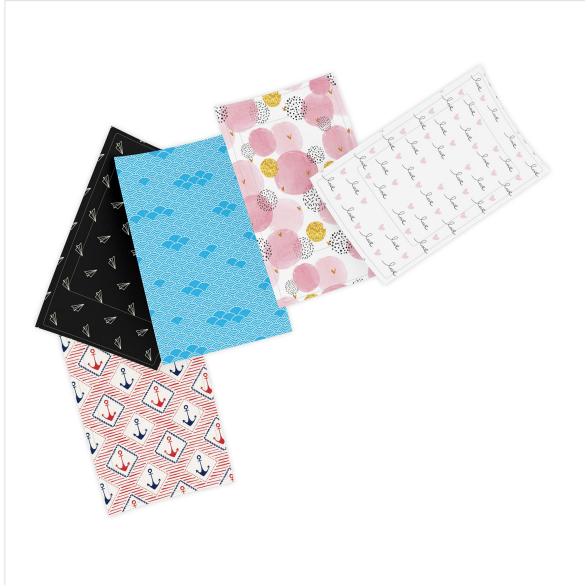
Imagem - Lensy -