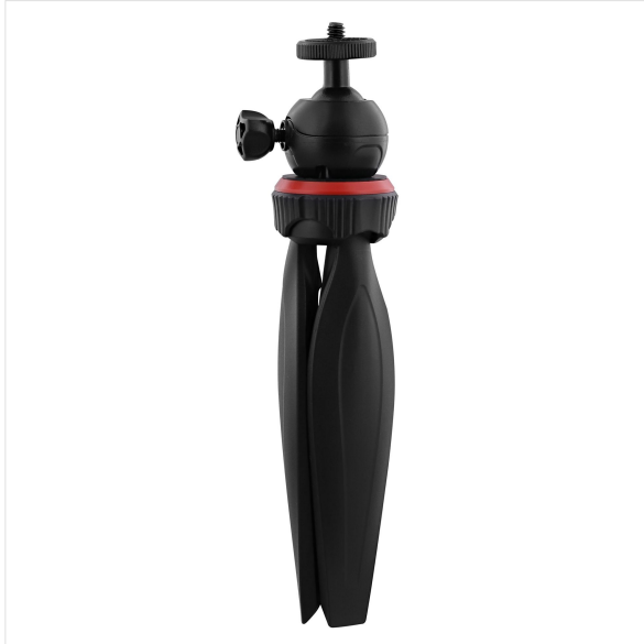
Imagem - influência -