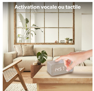
Activation vocale ou tactile