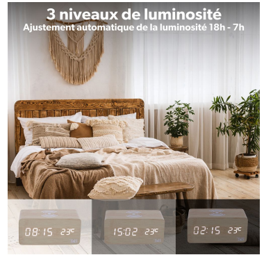
3 niveaux de luminosité Ajustement automatique de la luminosité 18h - 7h