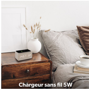
Chargeur sans fil 5W