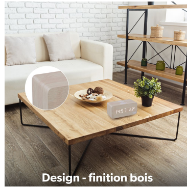
Design - finition bois