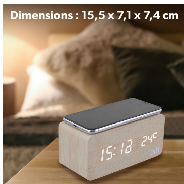
Dimensions : 15,5 x 7,1 x 7,4 cm