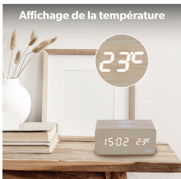
Affichage de la température