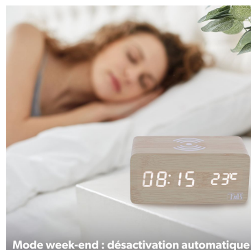
Mode week-end : désactivation automatique