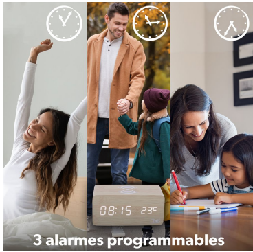
3 alarmes programmables